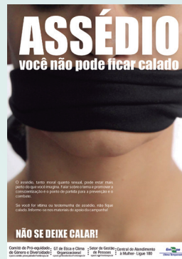
Embrapa Clima Temperado