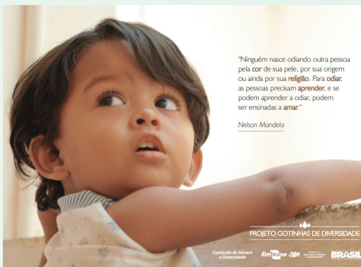
Embrapa Tabuleiros Costeiros