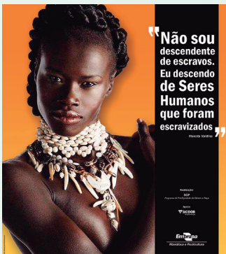
Embrapa Mandioca e Fruticultura